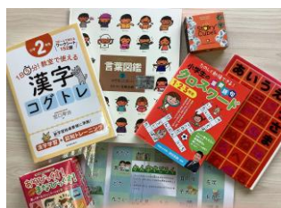
一人ひとりの言語発達に合わせた教材でことばが広がるように工夫して勉強します。