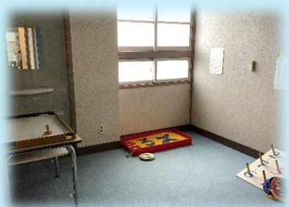
「プレイルーム」 この他に、ボールが思い切り投げられる広いスペースがあり、様々な感覚を養うことができます。