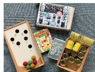
吹く・聞く・ことばを作るなど、遊び感覚で学べる教材がたくさんそろっています。