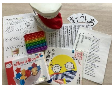
口の体操カードで意欲を高めながら、構音指導をしています。タブレットの録音機能を使っての自己判定も欠かせません。