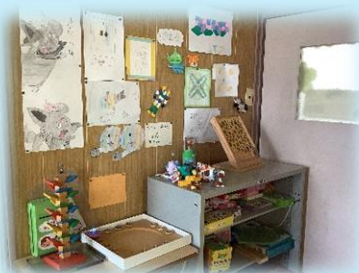
「共有スペース」 作品を飾ったり最後にひと遊びしたりします。