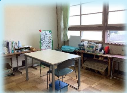
「指導室」 明るくて個別指導に適した広さが落ち着きます。