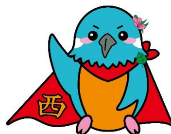
100周年記念キャラクター「にかちゃん」

今年度、西小学校は創立100周年を迎えました。「つなぐ・つむぐ」を合い言葉に、100周年の記念イベントも企画されています。「ウェルビーイング西小学校～西の子・保護者・地域・教職員が幸せを感じる学校～」をめざし、全校児童341人が学んでいます。