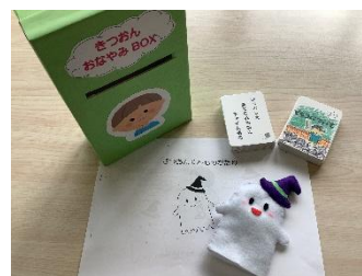
吃音指導では本や動画を見たり、クイズ・カルタなどをしたりしながら、吃音についての理解を深めます。